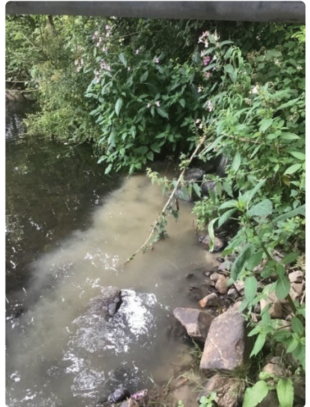
Llygredd carthion mewn afon

Gall carthion ddod o sawl ffynhonnell, gan gynnwys camgysylltiadau preifat - lle mae dŵr gwastraff wedi cael ei blymio'n wallus i system draenio dŵr wyneb.