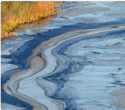
Gollyngiad olew.

Mae llygredd olew yn cael ei ddrysu'n aml â mater organig sy'n dadelfennu'n naturiol, sy'n gallu edrych fel llewyrch olewog hefyd. Y gwahaniaeth allweddol rhwng y ddau yw'r ffaith nad oes arogl tebyg i olew i ddeunydd organig sy'n dadelfennu, ac mae'n ymrannu'n ddarnau mân wrth aflonyddu arno. Mae arogl cryf i lewyrch olew ac mae'n torri'n dalpau mawr, gan ailffurfio'n gyflym ar ôl i unrhyw beth aflonyddu ar yr wyneb.