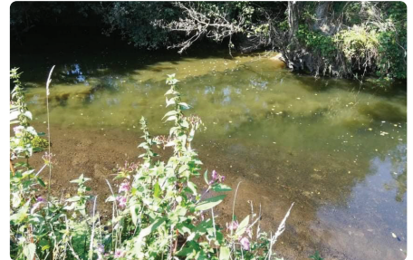
Llygredd slyri mewn afon.

Lliw brown sydd i lygredd slyri fel rheol, ac mae hyn yn aml yn gysylltiedig ag ewyn a drewdod unigryw.