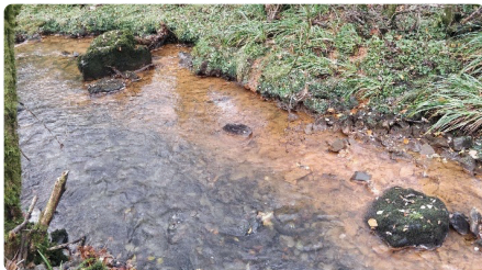
Llygredd dŵr mwyngloddio

Mae gan llygredd dŵr mwyngloddio liw llachar sy'n aml yn oren oherwydd yr haearn sydd yn y dŵr.