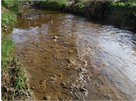
Ffwng carthion yn deillio o orlifoedd carthion.

Mae llwyth uchel o faetholion, fel slyri, carthion, elfiant silwair a thrwytholch yn gallu achosi ffwng carthion. Mae hi'n hanfodol eich bod yn rhoi gwybod am hyn, nid dim ond er mwyn mynd at wraidd y llygredd, ond hefyd er mwyn atal digwyddiadau rhag ehangu. Mae ffwng carthion yn llwyd, ac mae'n aml yn gorchuddio'r llystyfiant o dan wyneb y dŵr.