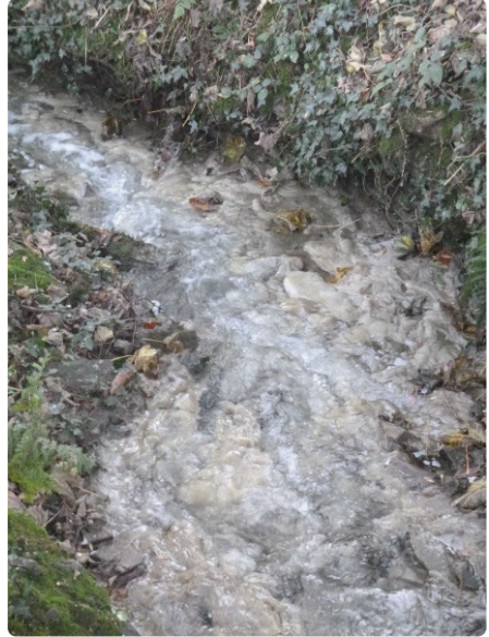
Ffwng carthion yn deillio o elfiant silwair.

Ffwng carthion, ond nid oherwydd carthion bob tro – symptom o lygredd?