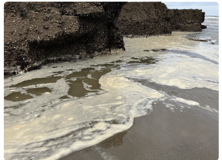
Ewyn môr Delwedd © Sue Burton.