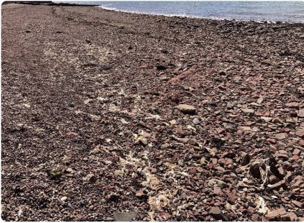
Gwymon ar wasgar ar hyd yr arfordir.

Er taw peth naturiol yw gwymon, mae gwymon sy'n prydu'n aml yn cael ei gamgymryd am garthion, yn enwedig am ei fod yn gallu drewi fel wyau clwc neu lysiau pwdr. Mae hyn am fod y mater yn dadelfennu, sy'n gallu bod yn arbennig o ddrewllyd mewn tywydd poeth. Mae gwynthoedd cryf yn gallu cynyddu faint o wymon sy'n cael ei olchi i fyny ar y traethau.