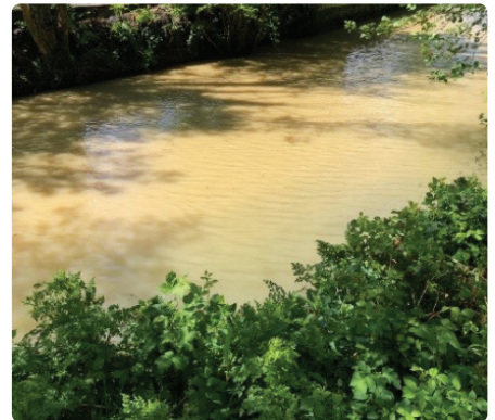
Llygredd sediment.

Os sylwch chi fod eich afon leol yn edrych yn fwy brown o lawer na'r arfer, mae hi'n werth rhoi gwybod am y peth. Hwyrach na fydd ymateb brys, ond mae'r adroddiadau hyn yn ein helpu ni i gael syniad o arferion tir gwael parhaus.