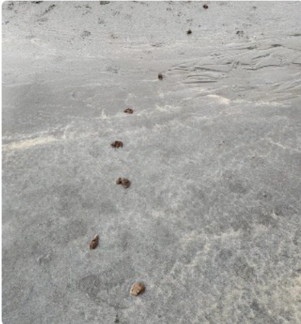
Baw cŵn ar dywod.

Mae hyn yn aml yn cael ei gamgymryd am garthion. Bydd elifiant carthion wedi teithio trwy'r rhydwaiath o garthfossydd, gan gymysgu a dadelfennu cyn cyrraedd allfa. Prin iawn y gwelir ysgarthion cyflawn wrth ollyngfeydd carthion.