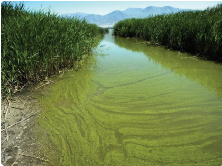
Algâu gwyrddlas (cyanobacteria)

Un math o algâu niweidiol sy'n gordyfu yw Cyanobacteria neu 'algâu gwyrddlas' (yn y llun isod), a hynny am ei fod yn dŵr cynhyrchu tocsinau. Mae'r tocsinau hyn yn gallu lladd anifeiliaid gwyllt, da byw ac anifeiliaid anwes. Maen nhw'n gallu niweidio pobl, gan achosi llied ar y croen trwy gyffyrddiad, a salwch o'u llyncu.