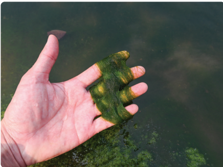
Algâu dŵr croyw