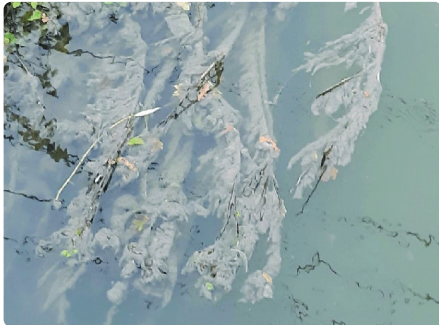
Ffwng carthion yn deillio o orlif carthion.

Ffwng carthion, ond nid oherwydd carthion bob tro – symptom o lygredd?