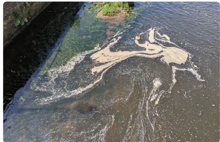
Ewyn algâu naturiol mewn afon.